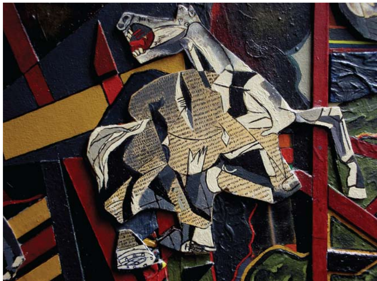
“Morir en España” Homenaje al Guernica de Pablo Picasso (detalle) Técnica mixta y collage sobre cartones montados sobre cartón - 21 x 35.9 cm - 2010

Ha participado en numerosas ocasiones en el programa “Colores Primarios”, conducido por Pablo Duarte, emitido por Radio Cultura.