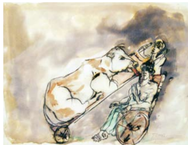
Rubén Borré - "Curando heridas" Tinta - 50 cm x 60 cm