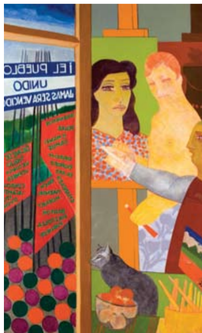
Roberto Duarte - "La manifestación" Óleo sobre tela - 120 x 180 cm - 2002