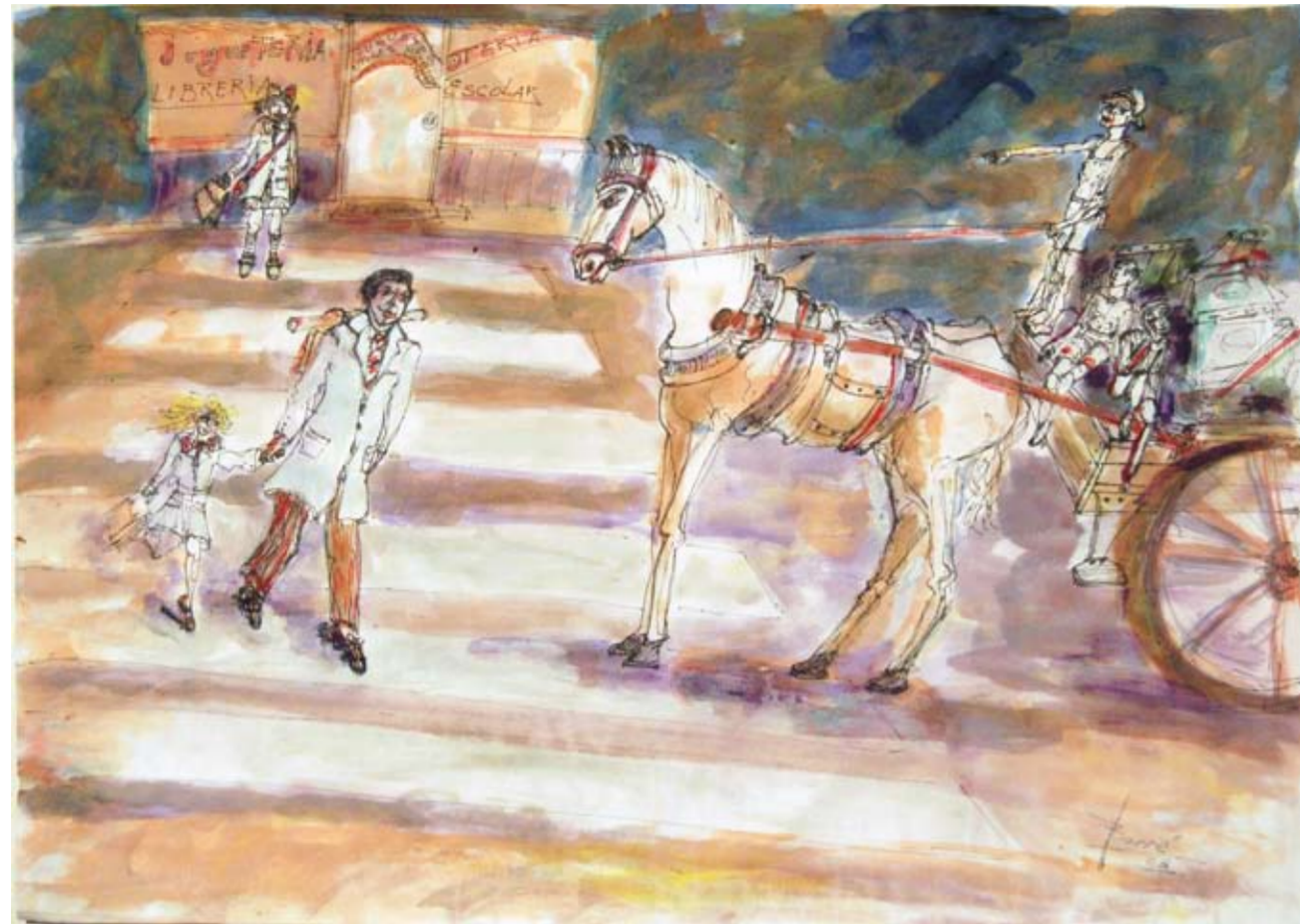
Rubén Borré - "Desigualdad" Tinta - 50 cm x 60 cm