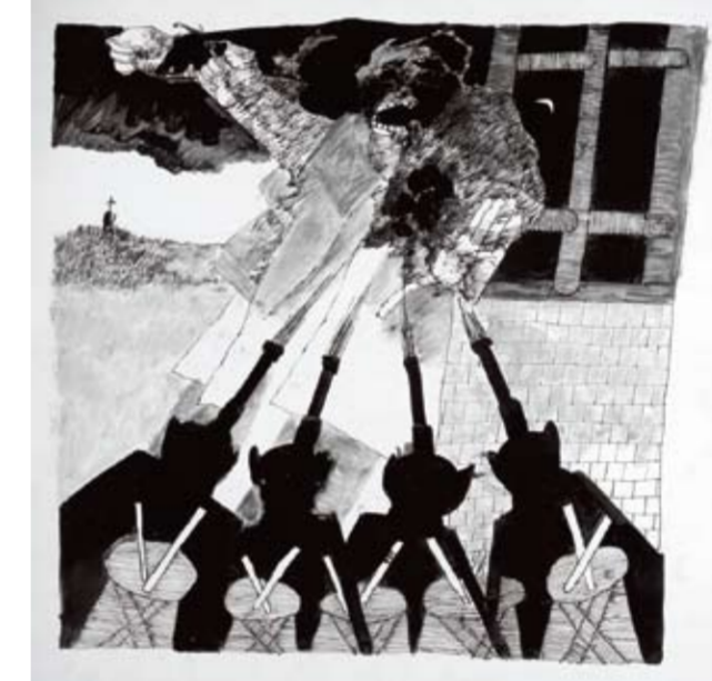
Roberto Duarte - "El Fusilamiento de Dorrego"

Basta mirar atrás en las diferentes ramas del arte de nuestro país para darse cuenta que existe un arte nacional. Ahora