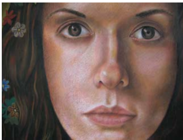
“Primavera latinoamericana” – Óleo pastel sobre papel misionero 79 x 104 cm - 2010

El collage tiene para mí una múltiple significación: alimenta un espíritu de insumisión que me