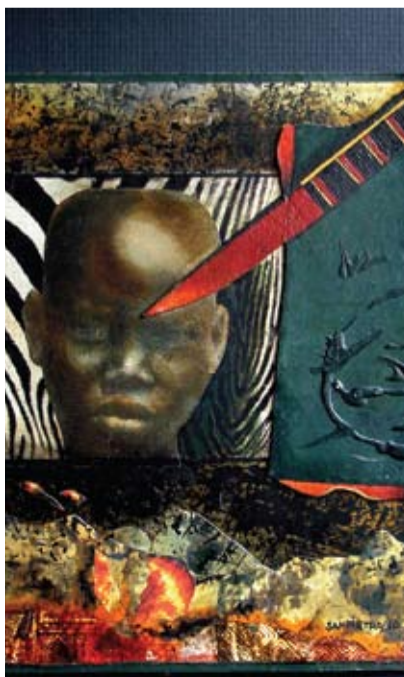
Emilio Sampietro - "El machete" Homenaje a Ruan-da - Técnica mixta y collage sobre papel y cartones montados sobre cartón - 27.7 x 41 cm - 2010