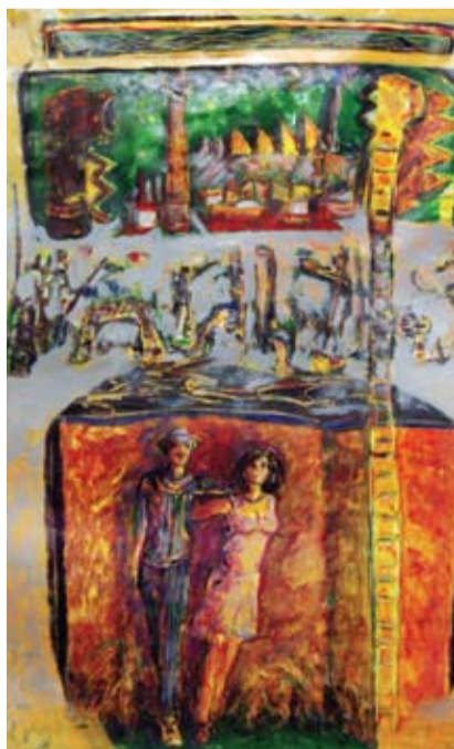
Rubén Borré - "Amor portuario" Pintura acrílica sobre tela - 150 cm x 100 cm

Para aquellos adherentes al oscurantismo, enervados ante la aparición de nuevas instancias culturales, mientras consagran valores fosilizados, es imprescindible que como artistas comprometidos con nuestro quehacer y nuestro tiempo, esgrimamos una respuesta auténtica, valerosa, y reveladora. "Ante la injusticia hay que perder la paciencia" José Saramago.