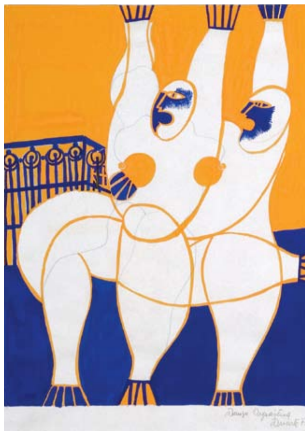
Roberto Duarte - "Danza orgiástica" Acrílico sobre papel - 25 x 35 cm - 1977