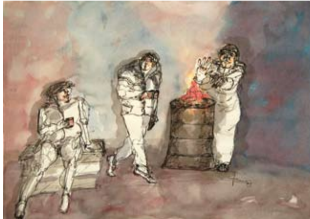
Rubén Borré - "Encuentro en el desencuentro" Tinta - 50 cm x 60 cm