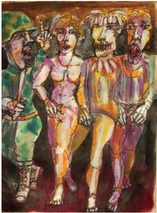
Rubén Borré - "Derecho a expresarse" Tinta - 30 cm x 40 cm