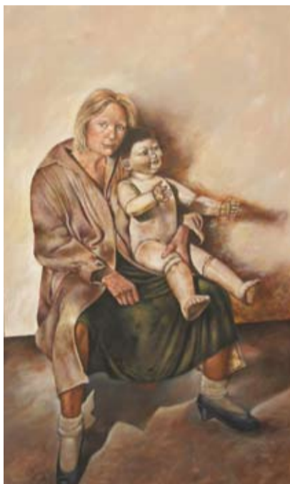
Emilio Sampietro - "Eva, homenaje a Tadeus Kantor" Pintura acrílica sobre tela - 150 cm x 100 cm