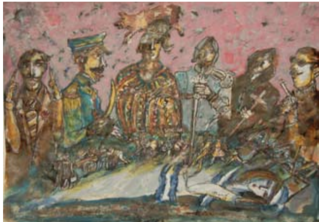
Rubén Borré - "Libertad de expresión I" Tinta - 30 cm x 40 cm

Acerca del tema se han escrito largos tratados para responder esta pregunta. Yo te diría que el arte es una expresión de deseo., una forma de dejar sentado en este mundo el paso del hombre, son su dolor, sus alegrías, sus afectos, su estética de vida. El hombre de las cavernas dibujó en ellas al mamut antes de cazarlo. Lo atrapó primero intelectualmente y lo perpetuó para contárnoslo a nosotros. Nosotros atrapamos otros miedos en nuestras telas para luego vencerlos, o no. Porque el arte sigue vigente porque es un maravilloso misterio. Rubén Borré