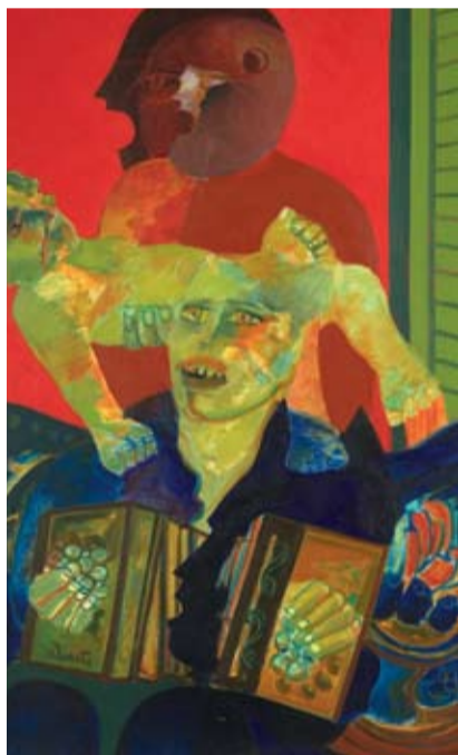
Roberto Duarte - "Gotán 77" Óleo sobre tela - 100 x 70 cm - 1977