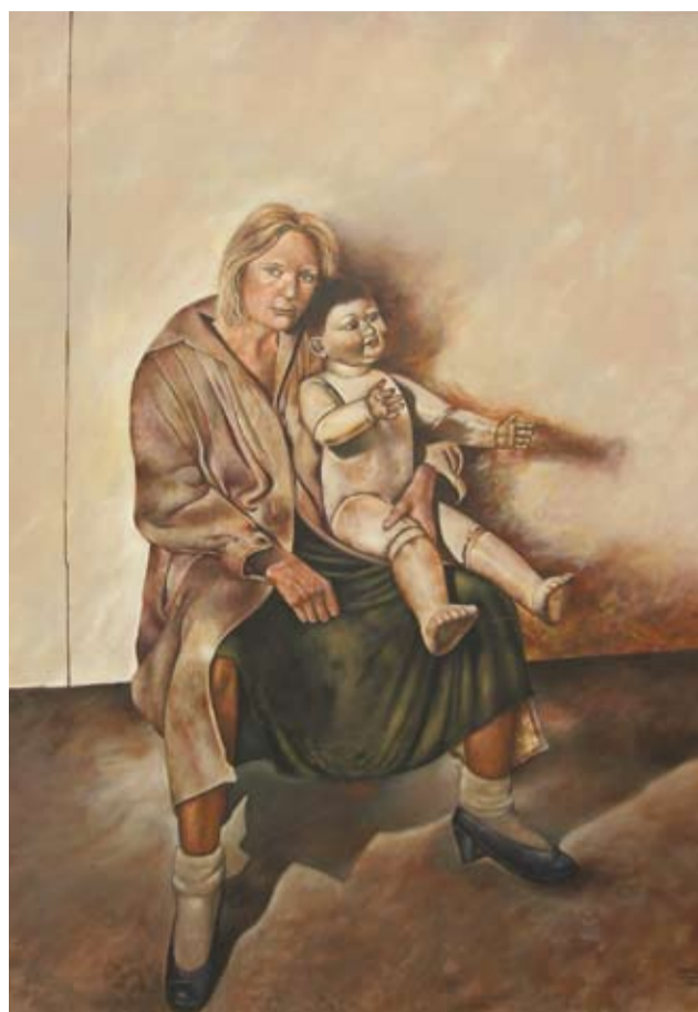
"Eva, homenaje a Tadeusz Kantor" Pintura acrílica sobre tela - 180 cm x 150 cm - Año 1984