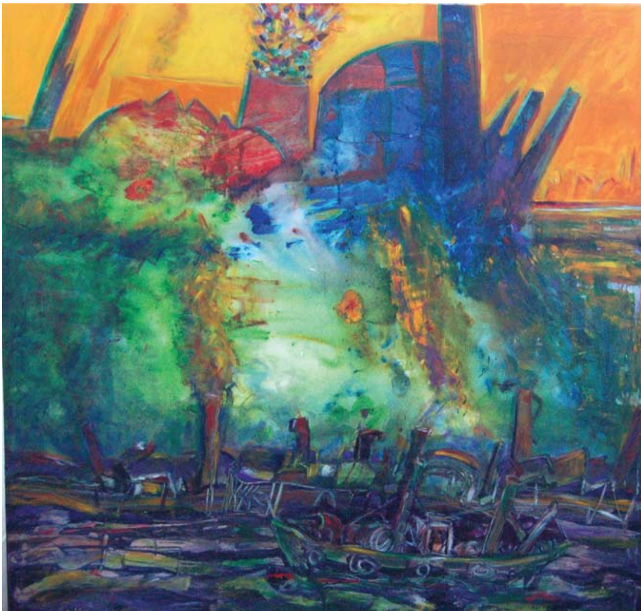
Rubén Borré - "Riachuelo" Acrílico sobre tela - 150 cm x 150 cm

Rubén Borré es un artista comprometido con su tiempo. Es Pintor, dibujante y escultor. Ha desarrollado una prolífica labor como animador sociocultural.