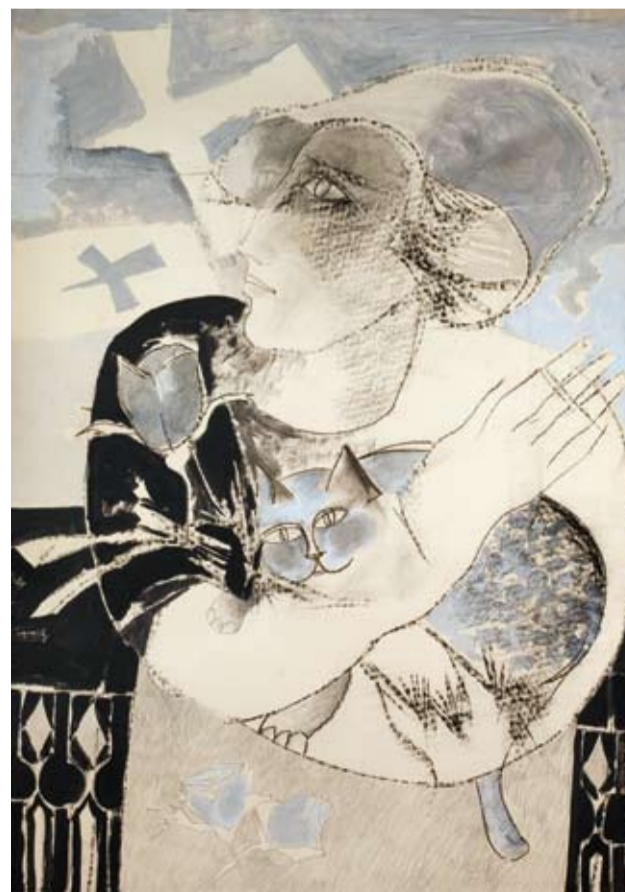
Roberto Duarte - "El Adiós" Técnica mixta - papel montado en tela - 100 x 70 cm - 1983

SUIPACHA 1315 - CP 1011 - CABA TEL/FAX: 4394 9978