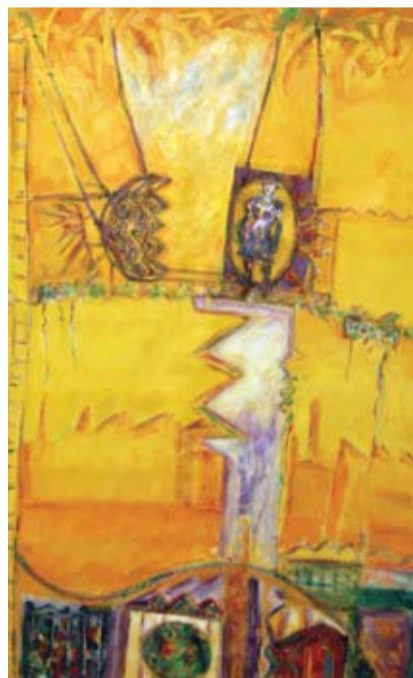
Rubén Borré - "La dama del guinche" Pintura acrílica sobre tela - 150 cm x 100 cm

MUESTRA COLECTIVA DE LOS ARTISTAS RUBÉN BORRÉ, ROBERTO DUARTE Y EMILIO SAMPIETRO, QUE PODRÁ VISITARSE EN LA GALERÍA DE ARTE RAÍCES AMERICANAS DESDE EL 17 DE SEPTIEMBRE HASTA EL 12 DE OCTUBRE PRÓXIMO.