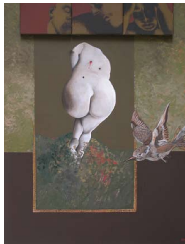
"El pájaro que quería ser feliz" - Pintura acrílica sobre tela - 120 x 100 cm 2º Premio de Pintura - Sociedad Hebrea Argentina

Asistente de dirección de la Galería del Buen Ayre (centro), dictó cursos de Historia del Arte en el área cultural del Centro Argentino de Ingenieros, fue codirector de la galería de arte Luna Verde, asistente de dirección de la galería El Puente, coordina visitas guiadas a Museos, Instituciones y Talleres de artistas plásticos y elabora prólogos para catálogos de exposiciones.