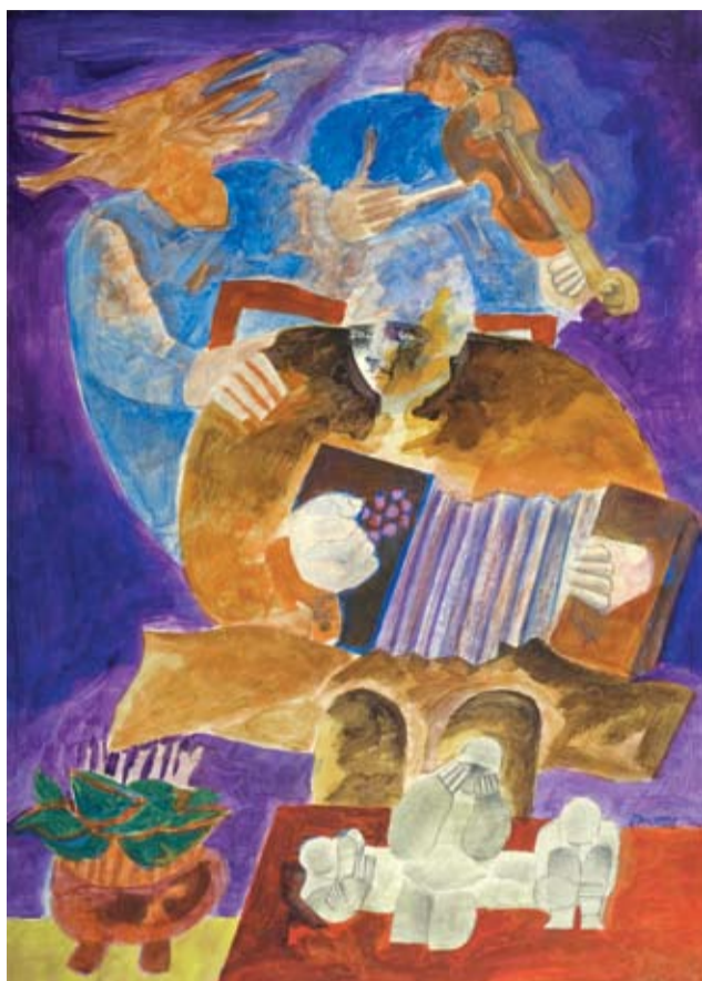
Roberto Duarte - "Tango" Óleo sobre cartón montado - 70 x 50 cm - 1973